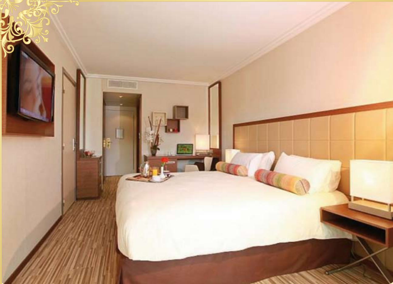
Luxury Room sea view (22 м²)

15 Junior Suite , четыре Executive Suite , один Presidential Suite .