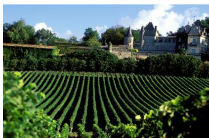
Виноградники в окрестностях Бордо